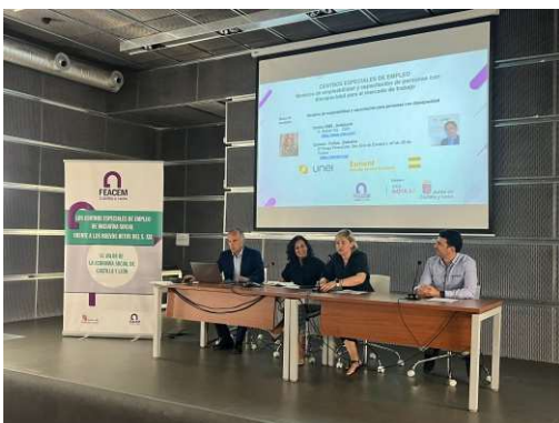
Mesa redonda Modelos de empleabilidad y capacitación para personas con discapacidad